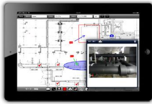
クラウド積算・業務管理システム spider Regalith Business management system

通常は紙ベースで持ち歩く図面は、A1 サイズが多く、空調設備、衛生設備などで分かれていて、さらに複数の現場がある場合は、全図面を持ち歩くのはほぼ不可能であった。当社の社員は 10 以上の現場を管理することから、このクラウド積算システム“スパイダー”にて検尺・積算を実施し、その図面データがクラウド化されることから、どの現場からでもその現場の図面を即座に iPad 上に呼び出すことが可能になった。また積算もそのクラウド上からしていることから、どのように断熱工事を見積積算したか同時に図面確認出来る。これにより現場での管理精度が大幅に上がった。