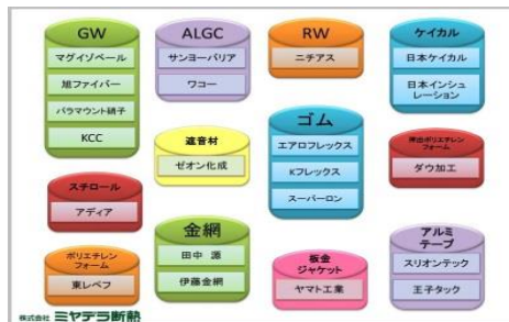
材料電子カタログ

従来は紙ベースであった断熱材料カタログ、MSDS、材料品質証明書、工事施工要領書など、膨大な全ての工事営業支援データを iPad に PDF 格納して、現場で得意先に、取引先に簡単に即座に提示することを可能にした。ページ抽出による当該資料のみのメール添付も可能にし、その場でメール出来るようにした。