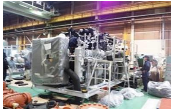
↑ 冷蔵冷凍機全景。メーカー内作業。-40℃製造冷凍機 ↓ 断熱作業5人くらいで取りかかる。この工期5~6日。