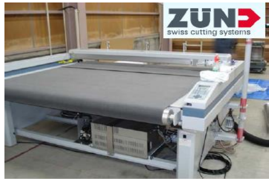
当社所有 CAD/CAM スイス ZUND 社製